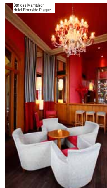
Bar des Mamaison Hotel Riverside Prague

MAMAISON präsentiert sich seinen Gästen in den sechs lebhaftesten, prestigeträchtigsten, stilvollsten und aufstrebendsten Städten des neuen Europas. // Located in six of the continent's busiest, most prestigious and most desirable destinations, Mamaison offers you a place to stay in New Europe's stylish, up-and-coming cities. Prag, Warschau, Bratislava, Moskau, Budapest und Ostrava