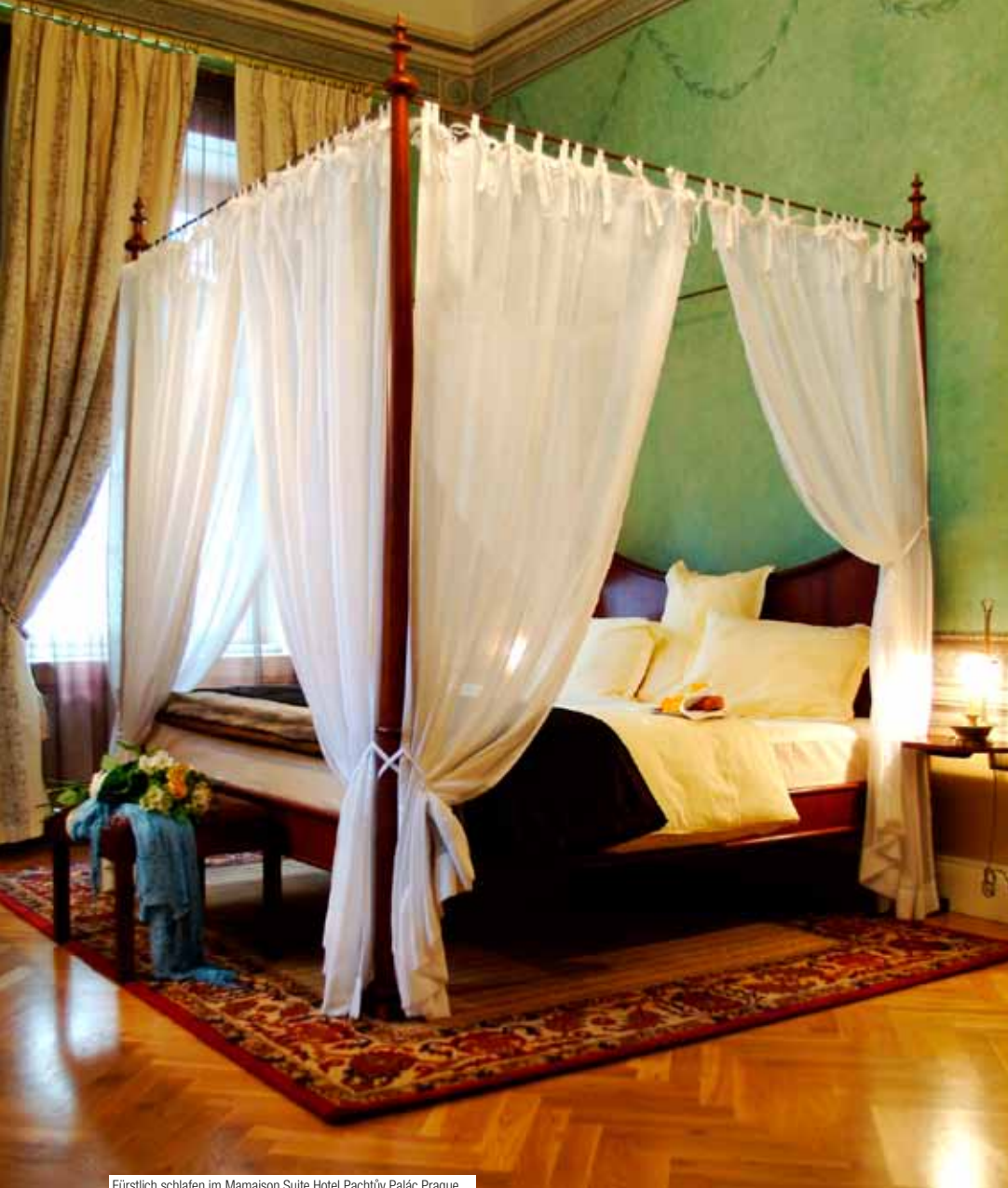
Fürstlich schlafen im Mamaison Suite Hotel Pachtův Palác Prague